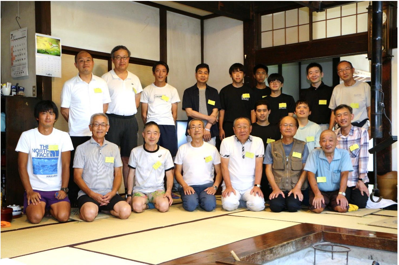
巻機山山麓の散策と雲天での親睦そばパーティー