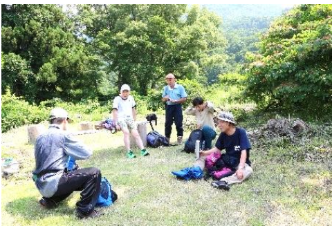
←旧山の家前の くつろぎ