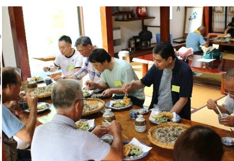
←ひたすら そばを食べ ました