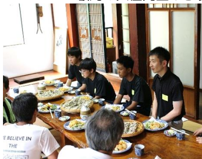
現役部員は雲天のそばは初めて