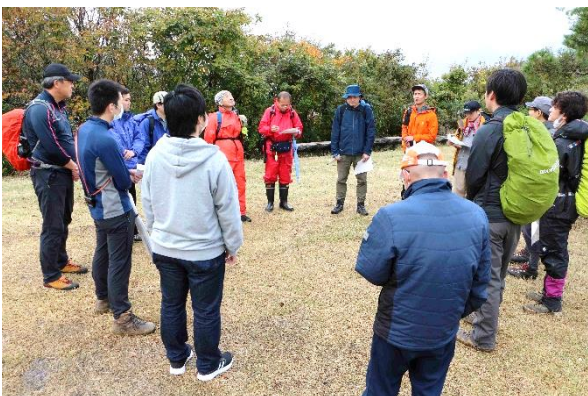
山頂でライダーズ・イン・ザ・スカイを合唱

クマ出没特別警報により登山活動が制限され、残念ですが命あつての安全登山なので仕方ないですね。