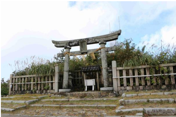
ご神廟に疫病退散を祈願

コロナ禍、行動を大きく制約されていますが元気で居ます。そろそろ引退したいところですが、2社の顧問要請を受け、ほぼ現役状態で出席できそうにありません。金沢へ来たら連絡ください。皆さんによろしく。