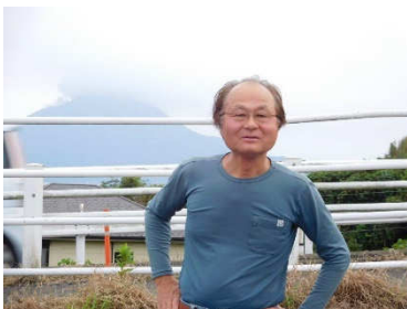
バックに桜島を望む

65 歳で国からの叙勲を受ける。70 歳の今でもフルタイムで福祉の仕事をしている立派な山岳部 OB なのだ！