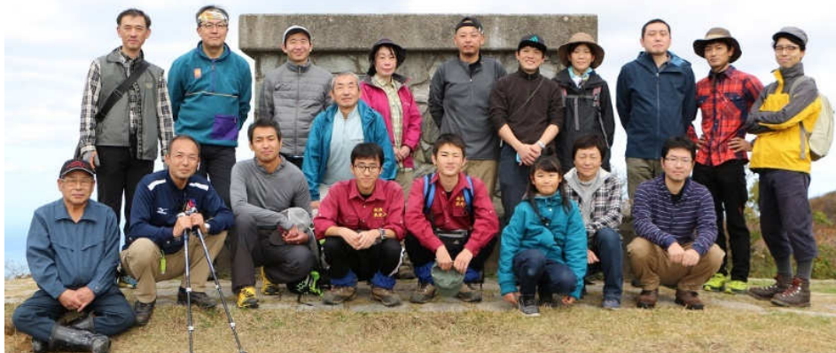
頂上の大平 園地で