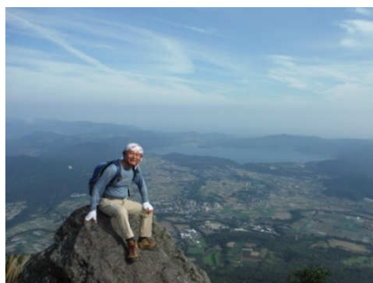
第一座目は晴れてくれた