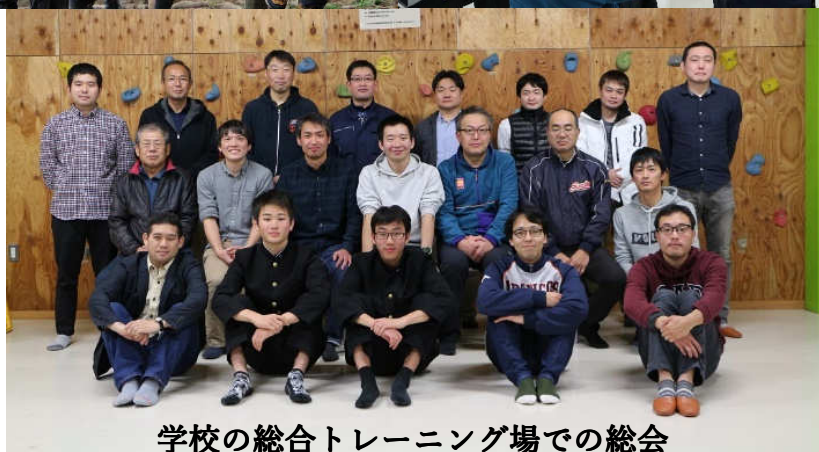
バックはクライ ミングボード