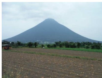
麓から開聞岳の眺め