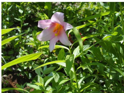
【祝福の一輪.jpg : 248.8KB】

2枚目、私の好きな風景の一つ。浅草岳頂上近くからの山並み。最奥は越後三山、その前は毛猛山の山群、一番手前は鬼が面山の山群です。標高2000mを越える中ノ岳、越後駒ヶ岳はまだ残雪が多い。ぜひ標高が高く登りがいのある山を生涯登山の目標としてもらいたいと思う。