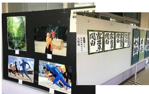
中止になった文化祭に替わって校内に展示発表したデジタル文化祭

進路指導部より進路内定状況の報告、特別講義についての担当教員からの報告など、より開かれた工業高校の充実した内容が読み取ることができます。